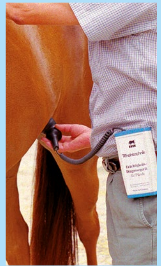
Messstelle und Ausrichtung der Sonde bei einer mindestens 12 Wochen tragenden Stute.

Results of a pregnancy diagnostics test from mares between the 11 th and 41 th week after mating.