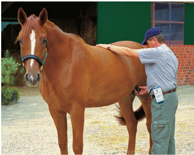
Abbildung 1: Die Sonde wird im Bereich zwischen Kniefalte und Euteransatz gegen die Bauchdecke gedrückt und schräg nach oben auf die gegenüberliegende Körperseite zwischen Hüfthöcker und letzter Rippe gerichtet.

Figure 1: Il faut légèrement presser la sonde entre le jarret et le pis sur la paroi abdominale en l'inclinant un peu vers le haut et en la pointant vers la partie comprise entre la hanche et la dernière côte du côté gauche de l'animal.